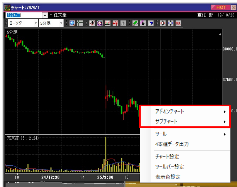
〈アドオンチャート〉